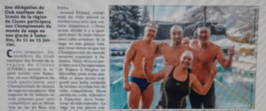
Une délégation du Club nautique des Scouts de la région de Cluses participera aux Championnats du monde de nage en eau glacée à Samonens, du 11 au 13 janvier.

Le club nautique des Scouts de la région de Cluses, composé de 200 nageurs, a organisé la compétition de nage en eau glacée à Samonens dans le lac bleu. Les épreuves ont eu lieu le 10 décembre 2017, en présence de 500 nageurs de 42 nationalités différentes.